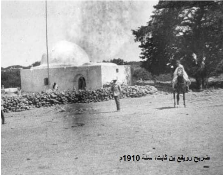
ضريح رويغ بن ثابت، سنة 1910م

وفاة الحبيب صلي الله عليه وسلم سنة 58 هجري، يعني بعد 47 سنة من وفاة سيدنا المصطفى صلي الله عليه وسلم، فقد كانت تصلي في حجرتها مع علم إلقاء الصحابة وفيها ثلاثة قبور هم خير البرية، هم الحبيب المختار صلي الله عليه وسلم، وسيدنا سيد أهل الغار حبيب المصطفى، وجاره في الغار سيدنا أبو بكر الصديق رضي الله عنه، ثم تكون الأمانة الأخيرة لزعيم الأمة سيدنا عمر بن الخطاب أن يدفن بجوار صاحبيه، فيستأذن في ذلك فلا يهتمه أحد بأنه مشرك قبور، وإنما يتضح ويبدو أن تلك رغبة السيدة عائشة فتقول: لقد كنت أريد هذا المكان، ولكنني اليوم أوثربه عمر رضي الله تعالى عنه.