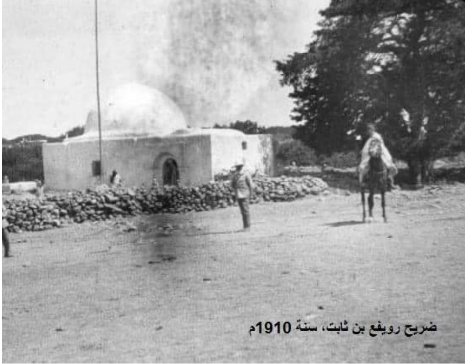
ضريح رويفع بن ثابت، سنة 1910م